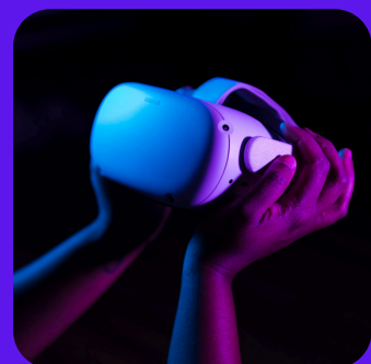
La réalité virtuelle