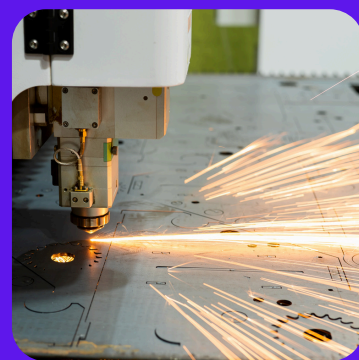
De la découpe laser