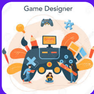
Le design des jeux vidéos