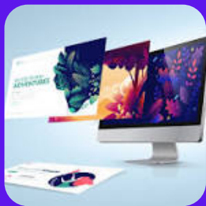
Le web design