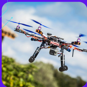
Une prestation de drone